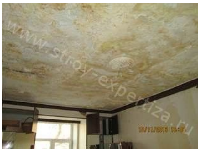
Повреждение помещений в вследствие залива