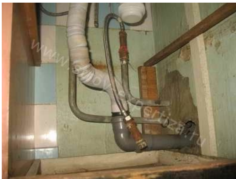
Независимая экспертиза металла и водопровода